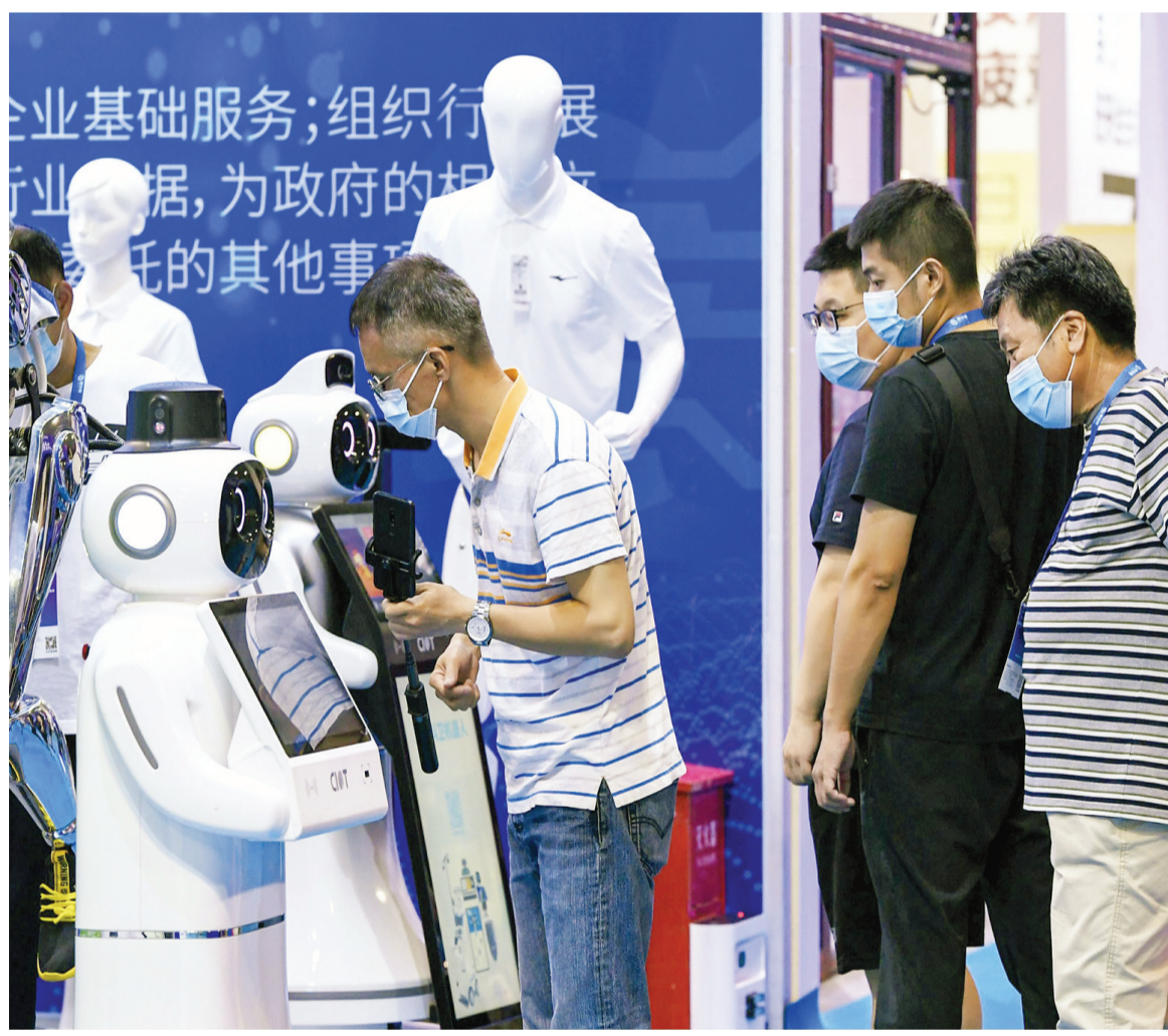
6月2日，為期3天的第4屆廈門國際零售業博覽會在廈門國際會展中心舉辦。現場共設國標標準展位近600個，展覽規模達2萬平方米，聚焦“零售數字化、未來店鋪展示、自有品牌運營”三大核心領域。